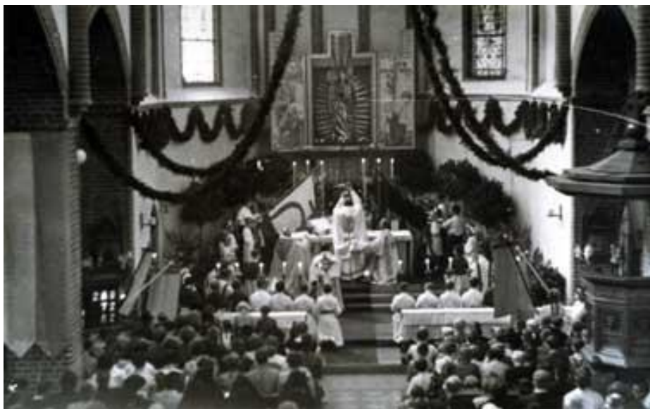
In der St Marien Kirche wurde ich am 13. Oktober 1926 getauft und erhielt am 4. März 1937 die erste heilige Kommunion