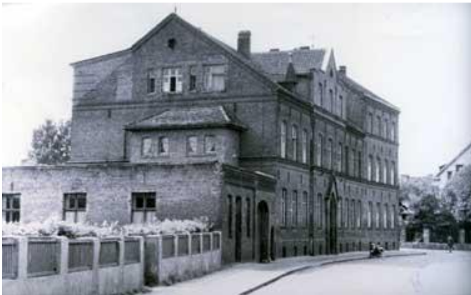
Das Kloster von der Straße aus gesehen

Das Kloster selbst ist ein großer Backsteinbau mit angrenzenden Nebengebäuden, die sich rings um den großen Hof gruppieren. An die Gebäude angeschlossen liegt der kleine Garten mit seinen zahlreichen Obstbäumen und Sträuchern, einer großen Wiese, die Wege alle mit Blumen eingefasst. Die Blumen brauchte man für die Altäre der Kirche und der Klosterkapelle. Die Wiese diente alle vier Wochen bei der großen Wäsche als Bleiche.