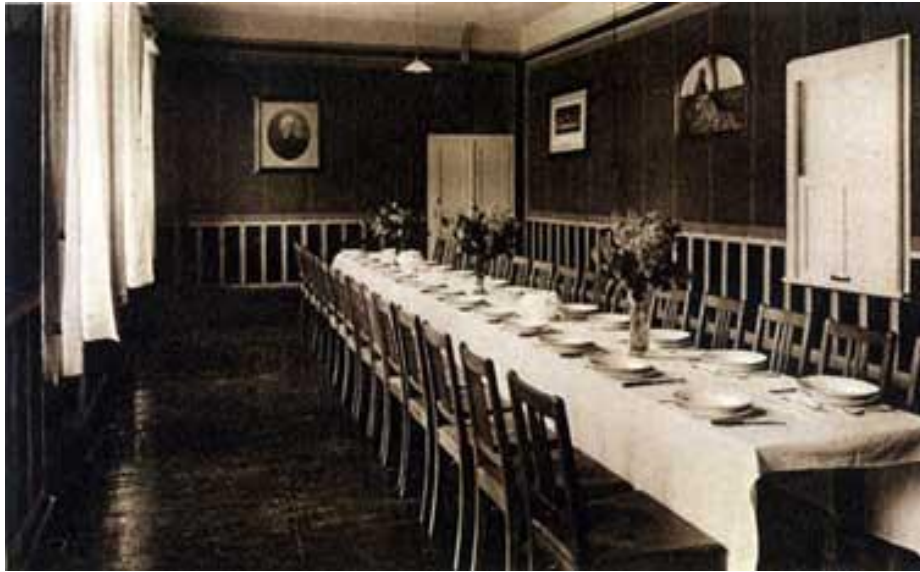
Der große Speisesaal im Kloster

Der Lieferanteneingang war links vom Hauptgebäude, danach kam der Kindergarten, die Nähsschule und dann der Schauer. Der Schauer war ein Raum, der zum Hof hin offen war. Dort wurden im Winter Sachen untergestellt, sowie die Wippe, das Karussell und andere sperrige Güter.