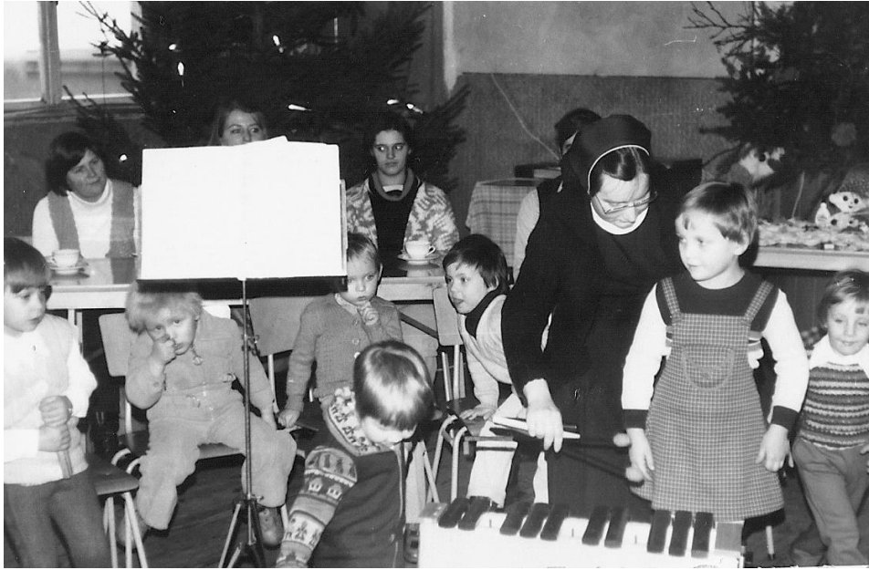
Weihnachtsfeier Dezember 1981