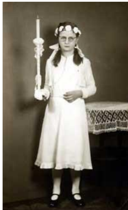
Ich bei der ersten heiligen Kommunion