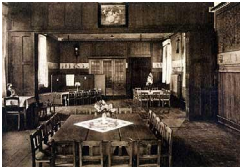
Der Speisesaal im Kloster