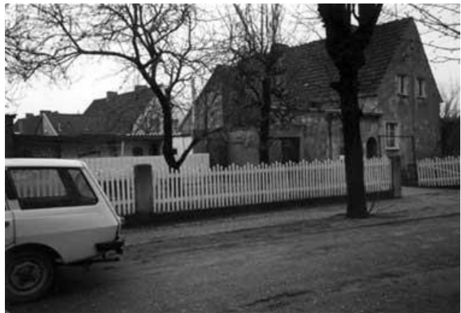
...nach der Wende

Als das neue Haus fertig war und wir einziehen wollten, kam das große Unglück über unsere Familie. Mama wurde krank und ist gar nicht in das neue Haus eingezogen. Nun stand der Papa da – sechs Kinder und die Mutter krank, was sollte er machen? Die Oma war alt und hatte Gicht, sie