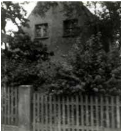
Blick auf das Elternhaus in der Lazarettstr. in Oschersleben zu meiner Kinderzeit und...

Wir bewohnten das letzte Haus der Stadt, es war eine Werkswohnung. Meine älteste Schwester Lene hatte immer einen sehr weiten Weg zur Schule, das wollten unsere Eltern ändern und so haben sie ein Haus gebaut. Es ist ein schönes Haus mit sechs Zimmern, einem Stall und einem schönen Garten, es steht in der Lazarett Straße.