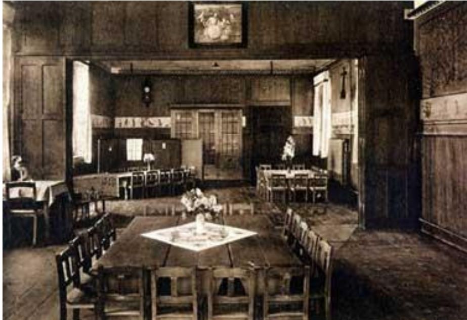
Blick in den Kindergarten des Klosters. Hier waren etwa 70 Plätze vorhanden.