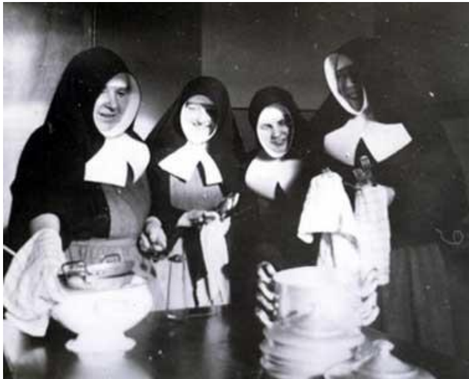
Vier Nonnen aus unserem Kloster

Aufenthaltsraum. Der Knabenaufenthaltsraum, sowie die Kleiderkammer, in der riesengroße Schränke standen. Im ersten Stock waren auf der linken Seite die Klausur, Seniorenzimmer, rechts der Knabenschlafsaal und in der Mitte unsere wunderschöne Kapelle. Sie schmückte ein schöner heller Altar, in dem das Allerheiligste untergebracht war, nicht wie heute leider üblich in einer Nische. Rechts und links waren, je ein schönes Fenster in Blei gefasst. Das Linke stellte die Heilige Elisabeth dar und das Rechte den heiligen Franz von Assisi.