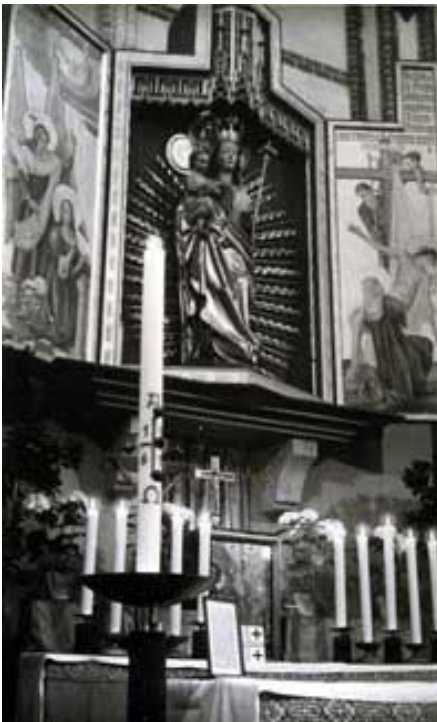
Hier in der St Marien Kirche erhielt ich meine erste heilige Kommunion