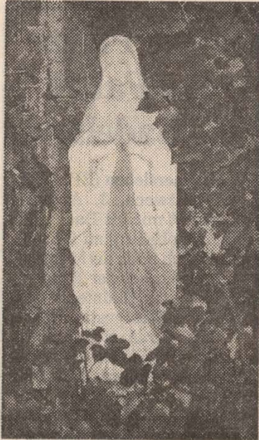
Die Madonnenfigur aus Gips.